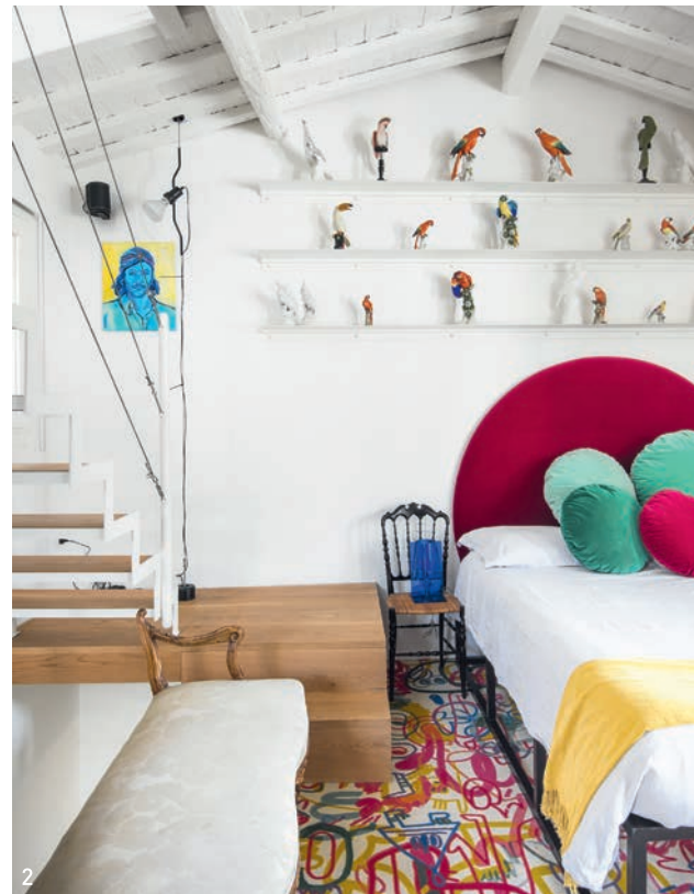
散落的色彩、迥异的材料搭配， 展示物品与艺术创作边界的大胆探索。