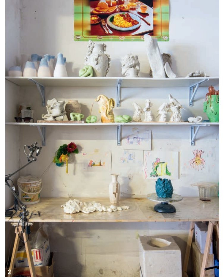
对页 陈列柜内是他收集的各式古董鼻烟壶,倒数第二层正中位置摆着一个黄色和紫红色的小雕塑,它是Guglielmo Maggini使用聚氨酯橡胶制作的。在最低的一层,是他创作的Swimmers(《游泳者》)釉面陶瓷雕塑系列(2018年)。 本页 1. Guglielmo Maggini设计的铁制书架,架上摆着他的Vasi Roma釉面陶瓷器皿作品(2018年),角落处, Flos的Toio落地灯由Achille & Pier Giacomo Castiglioni设计,聚碳酸酯材质的长桌由Guglielmo设计,桌子两侧的座椅是Marcel Breuer设计的Cesca B32椅。2. 工作室内的细节,陈列架顶层摆着被这位艺术家称作Within 10 Minutes(10分钟内)的10个氧化砒质雕塑(2018年),低层的架上左侧,名为Biotropic的“轻雕塑”,使用橡胶和聚氨酯树脂制作(2020年),在升降式支架桌上,一件被称为Blue Shape Attempt(蓝色形状尝试)的釉面陶器(2019年)。3. 墙上Rio de la Plata雕塑,是Guglielmo使用染色聚氨酯橡胶完成的作品,创作于2020年。